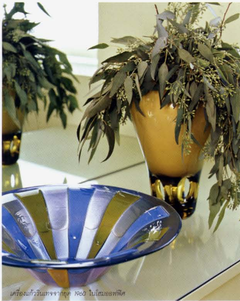
เครื่องแก้ววินเทจจากยุค 1960 ในโฮมออฟฟิศ