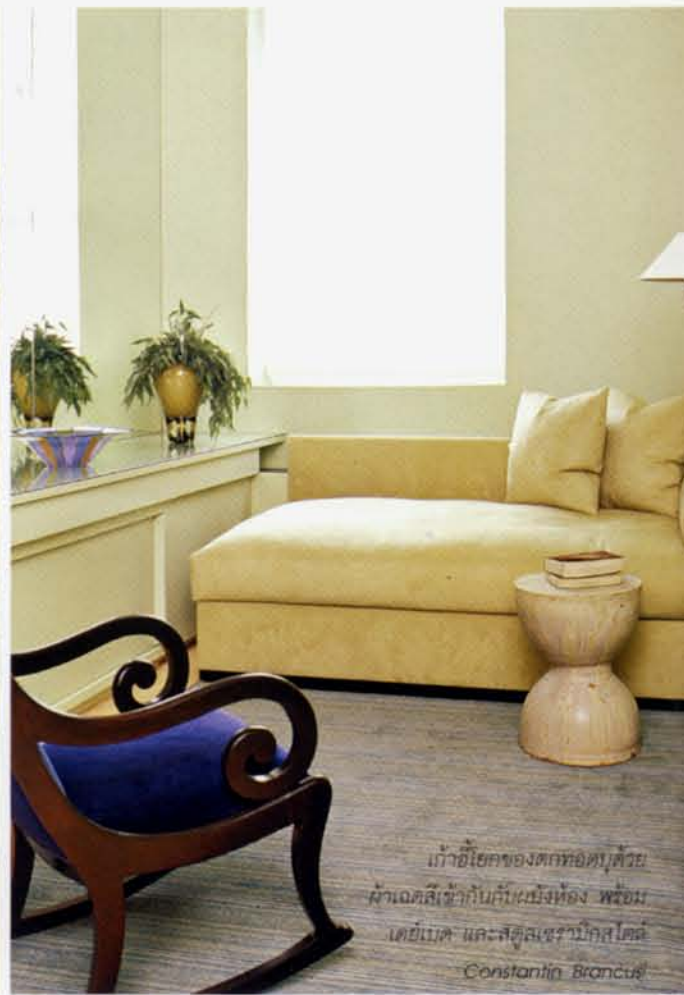
เก้าอี้โยกของตลกทอด้วย ผ้าเดคส์เข้ากันกับเบาะห้อง พร้อม เคย์เบค และสตูล์เซรามิกสไตล์ Constantin Brancusi