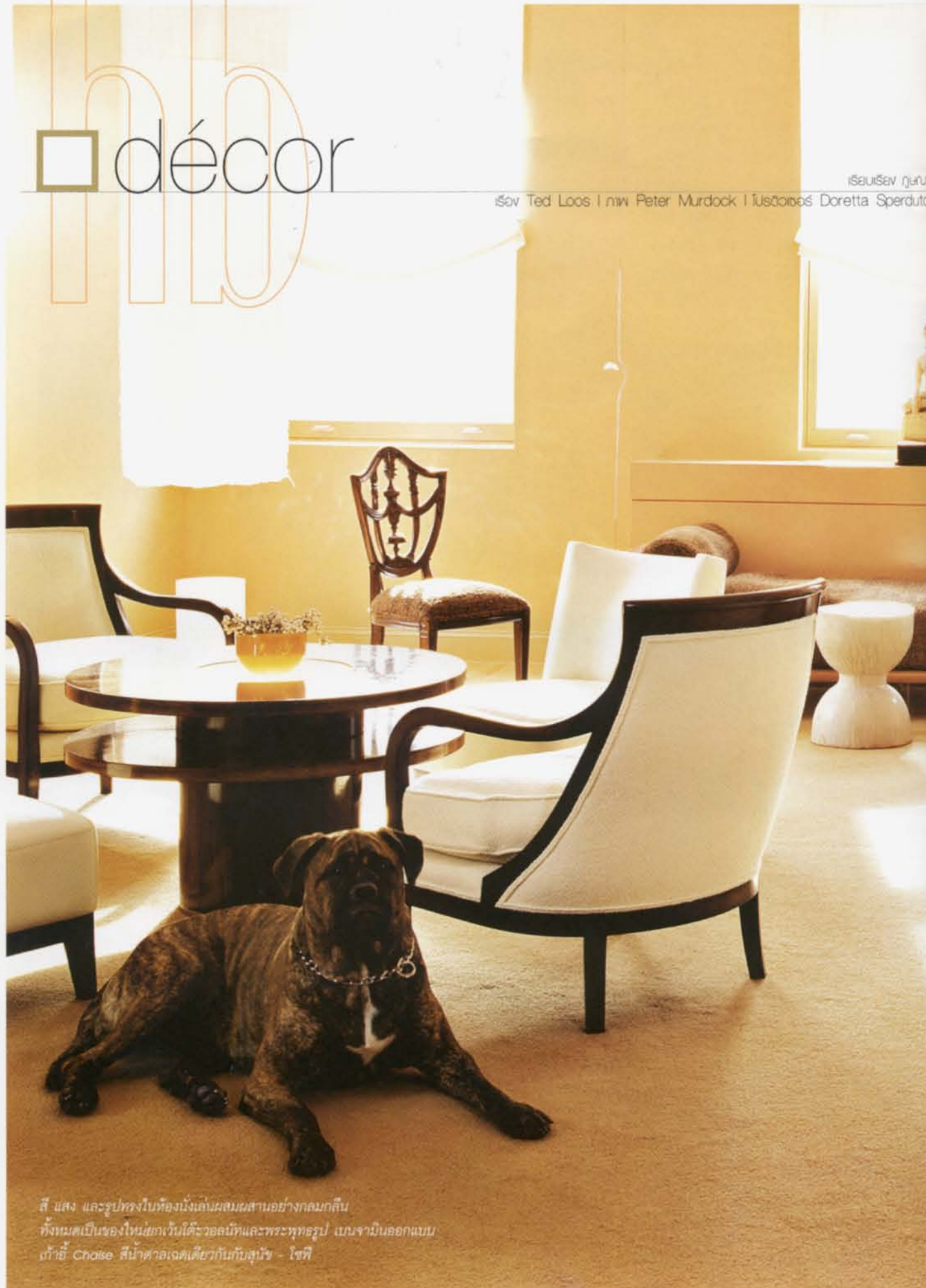
สี่ แสง และรูปทรงในห้องนั่งเล่นผสมผสานอย่างกลมกลืน ทั้งหมดเป็นของใหม่ยกเว้นโต๊ะวอลนัทและพระพุทธรูป แบบจามีนอกแบบ เก้าอี้ Chaise สีน้ำตาลแดงเดียวกับกับสุนัข - โซฟี

เร้าริเซว ฌูเน่ Sev Ted Loos | ฌูเน่ Peter Murdock | ฌูเน่ Doretta Sperduto