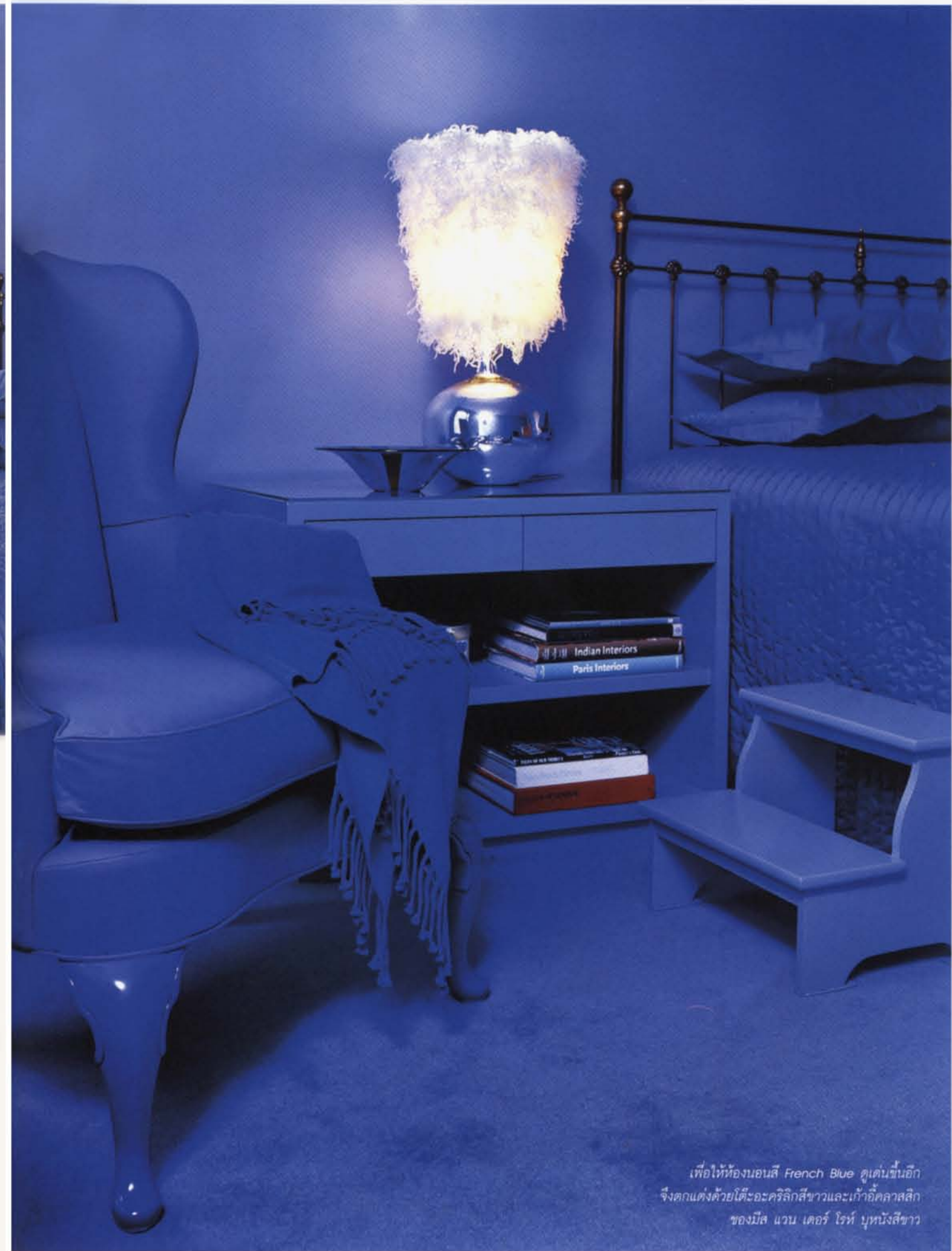
เพื่อให้ห้องนอนสี French Blue ดูเด่นขึ้นอีก จึงตกแต่งด้วยโต๊ะอะคริลิกสีขาวและเก้าอี้คลาสสิกของมิลส แวน เคอร์ โรห์ บูทนังสีขาว

สำหรับคู่รักนักกฎหมายคู่นี้แล้ว นับเป็นการตัดสินใจที่ถูกต่องยิ่งนัก •