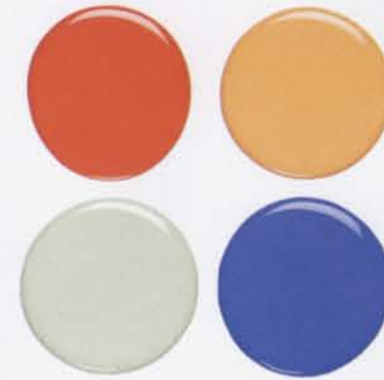
• เฉดสีสดจาก Benjamin Moore - - สี Soft Pumpkin, Blue Lapis, Fire Dance, Gullford Green เติมพลังและความอบอุ่นให้ออฟต์