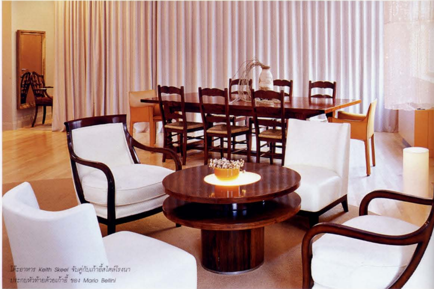
โต๊ะอาหาร Keith Skeel จับคู่กับเก้าอี้สไตล์เรอเนซองส์ ประจบหัวท้ายด้วยเก้าอี้ ของ Mario Bellini