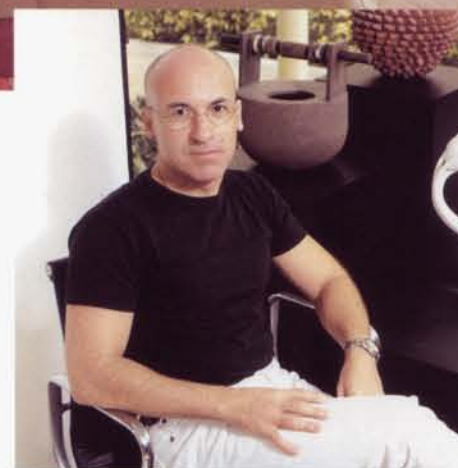
Benjamín Noriega-Ortiz es reconocido como uno de los más influyentes diseñadores de interiores de América.

Entre los accesorios decorativos que se integran en esta decoración resalta el uso de frutas en colores brillantes, que se han colocado formando gráficas