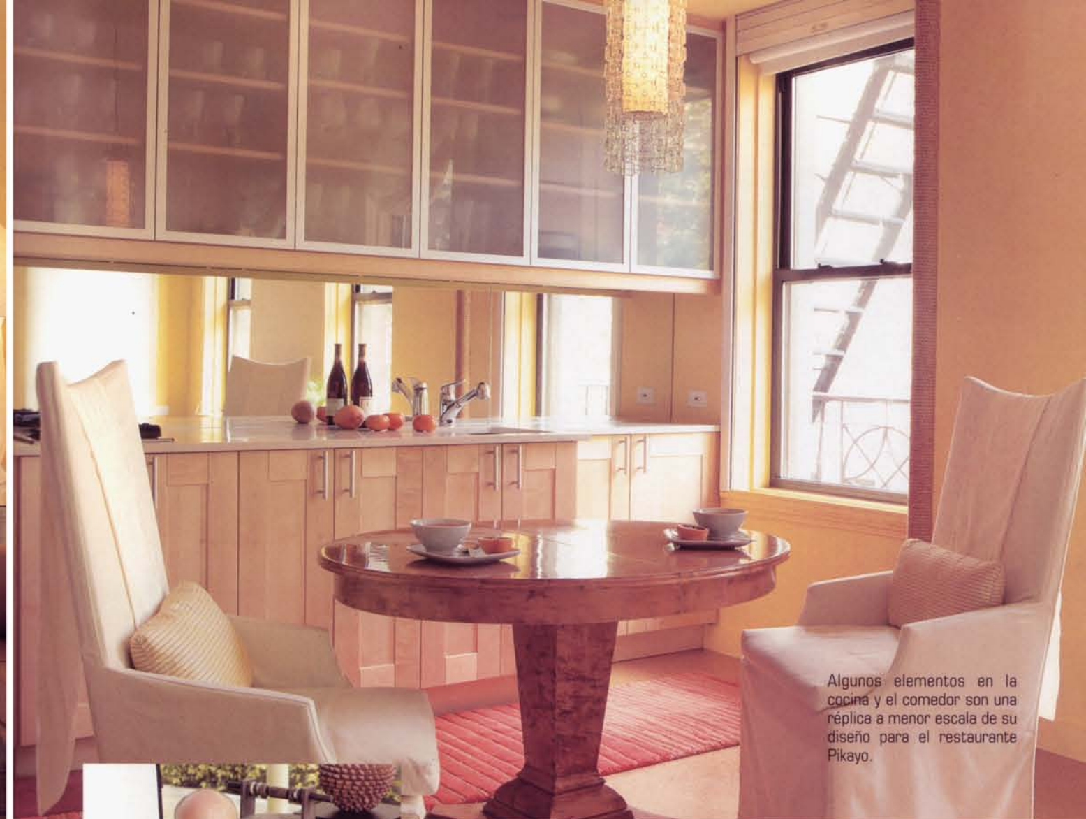
Algunos elementos en la cocina y el comedor son una réplica a menor escala de su diseño para el restaurante Pikayo.