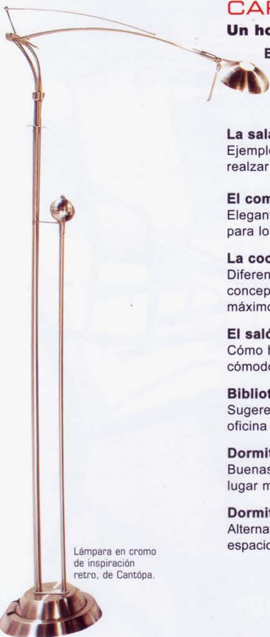
Lámpara en cromo de inspiración retro, de Cantópa.

Arte .....162 Cómo enmarcar arte.....164 Los beneficios de un consultor de arte .....165 Cómo comenzar una colección de arte .....167