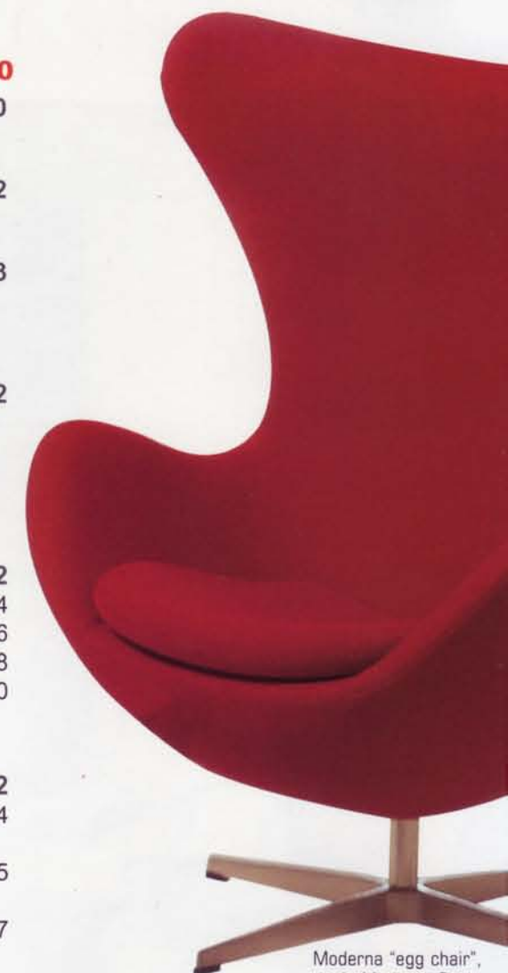
Moderna "egg chair" de Moda en Casa.