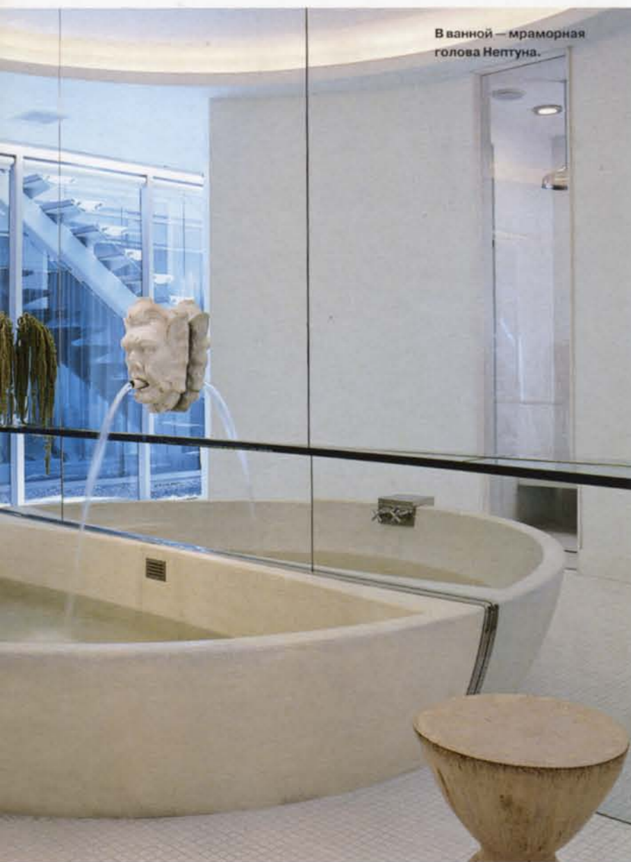
В ванной — мраморная голова Нептуна.

> огромная прихожая. Посреди комнаты — концертный рояль из прозрачного акрила. Фирма Kawai производит такие уже тридцать лет; рояль, который теперь стоит у Кравица, когда-то принадлежал Ингрид Бергман. Здесь же — агрессивного дизайна лестница на второй этаж: стекло и металл, ступеньки покрыты мохнатым ковром. Направо — пространство наподобие зимнего сада с зеркальной стеной в торце. Из мебели — полированный стальной бильярдный стол. Под потолком высотой восемь метров парят шарообразные светильники, покрытые страусиными перьями. Их постоянно колышет легкий ветерок — результат специальной настройки кондиционера.