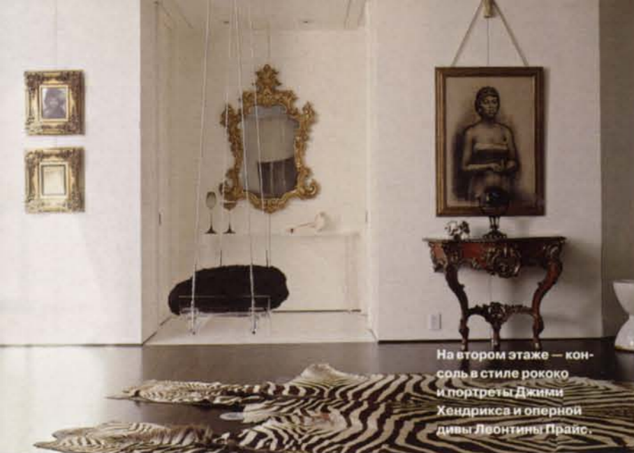
На втором этаже — консоль в стиле рококо и портреты Джими Хендрикса и оперной дивы Леонтины Прайс.