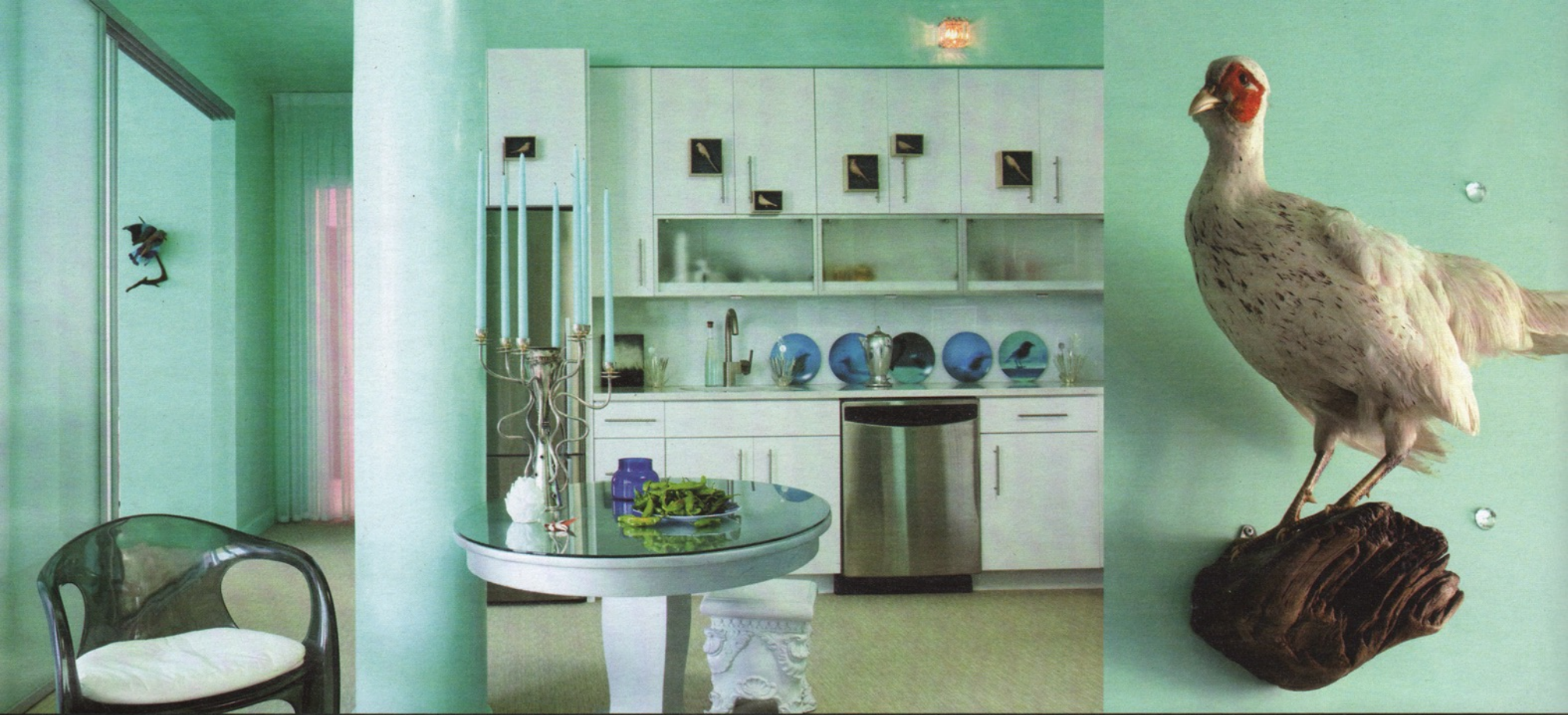
In alto, da sinistra in senso orario: la cucina a vista, dettagli ornitologici, il ritratto di Maria Antonietta e uno scorcio del salone con pareti blu Tiffany